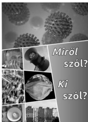
A kiadvány címlapja és...

Ahogy márciusban hazánkat is elérte a járvány, és életbe léptek a korlátozó intézkedések, egyre többször voltak bennem, bennünk ezek a kérdések: Mit akar ezzel nekünk Isten mondani? Mit mondhatunk mi ebben helyzetben a körülöttünk élőknek? Így készült el ez a kis írás, amelyet aztán több, mint 26'000 példányban küldtünk el EMO munkatársaknak és partneryülekezeteknek, hogy oszthatassák a környezetükben. Több gyülekezet a település valamennyi családjához eljuttatta. Aztán felmerült az is, hogy jó lenne nem csak olvasható, hanem hallgatható formában is közreadni, hiszen egyre többen ezt a formát „fogyasztják” szívesebben. Többek segítségével aztán nemrég elkészült a videó változat is, és már ez is eljutott több száz