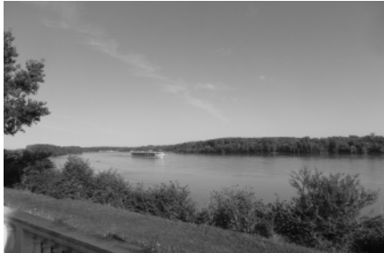
Gyönyörű Duna-part a szállásunk teraszáról

Aztán elgondolkoztam... és Isten is reagált: