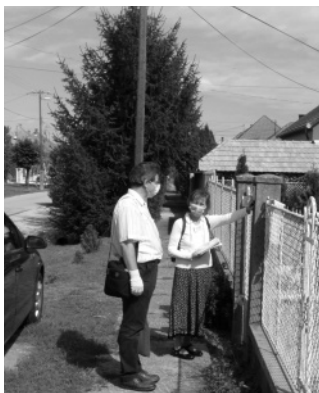
Maszkban, kesztyűben házról-házra