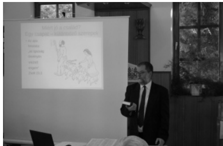
Előadás a templomban

Az előadás megnézhető az EMO facebook oldalán!